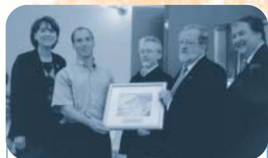
Ville de Victoriaville : Les vélos communautaires