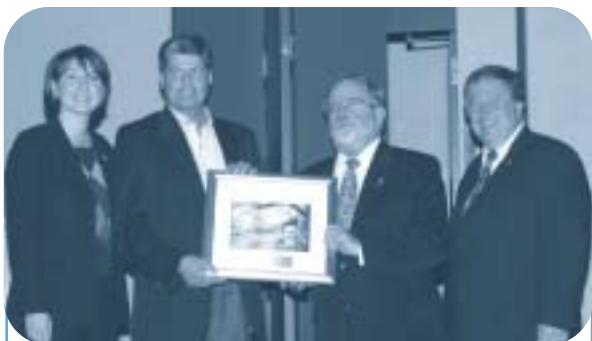
Municipalité de Saint-Adolphe-d'Howard : La protection des berges et du milieu aquatique