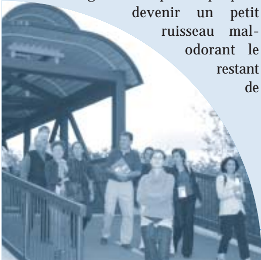
VISITE DU SITE

Mais l'endroit est fréquenté, l'objectif est atteint. ▲