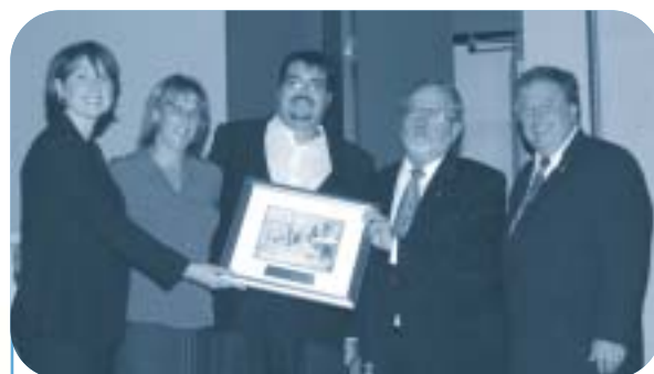
Ville de Salaberry-de-Valleyfield : Moi, je fais partie d'une bonne gang!