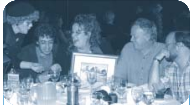
Arrondissement de Beauport : Beauport Solidaire