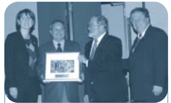
Ville de Québec : La pénurie de logements et le partenariat