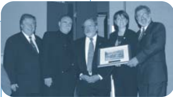
Municipalité de Métabetchouan-Lac-à-la-Croix : La ferme animée du Saguenay-Lac-Saint-Jean