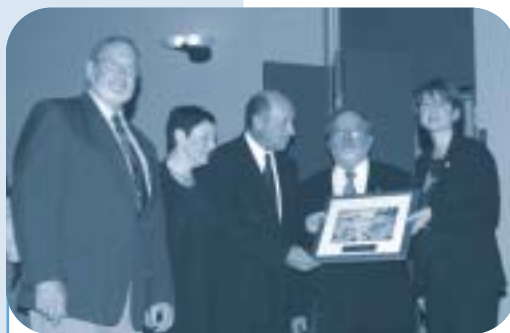
Ville d'Edmundston : Carrefour des citoyens d'Edmundston