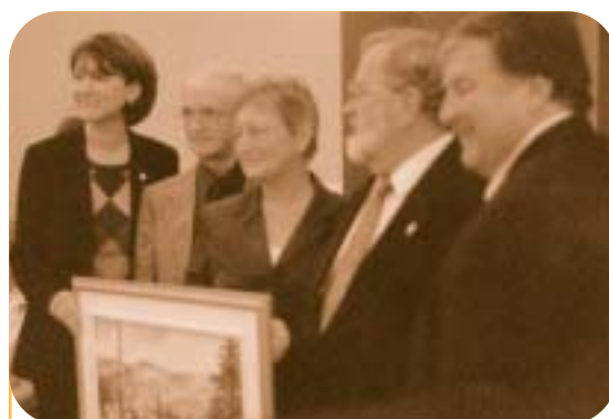
Municipalité de Notre-Dame-du-Nord : Mobilisation des partenaires pour une approche intégrée de promotion de la qualité de vie des citoyennes et citoyens