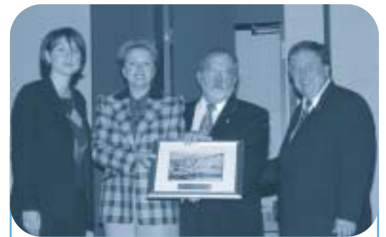
Ville de Laval : Droit de cité