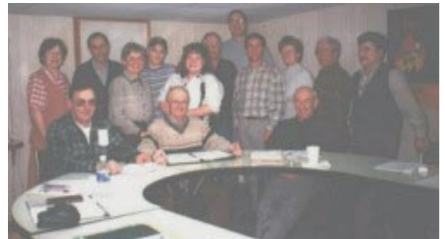
Les membres du conseil d'administration

Le Comité Notre-Dame-du-Nord en santé tenait sa première assemblée générale annuelle le 22 février dernier. La municipalité de Notre-Dame-du-Nord adhère au Réseau québécois au printemps 1998. Elle fut suivi par la nomination des membres du conseil d'administration composé de 11 membres dont 9 issus du milieu et 2 du conseil municipal dans le cadre de sa rencontre régulière. Des représentants de la Société de développement du Témiscamingue, du Centre de santé Ste-Famille et de la Santé publique ont aussi assisté aux rencontres tenues au cours de l'année 1999.